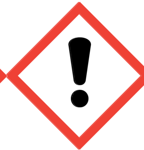
Toxicidad Corrosivo Irritante Sensibilizante Categoría baja