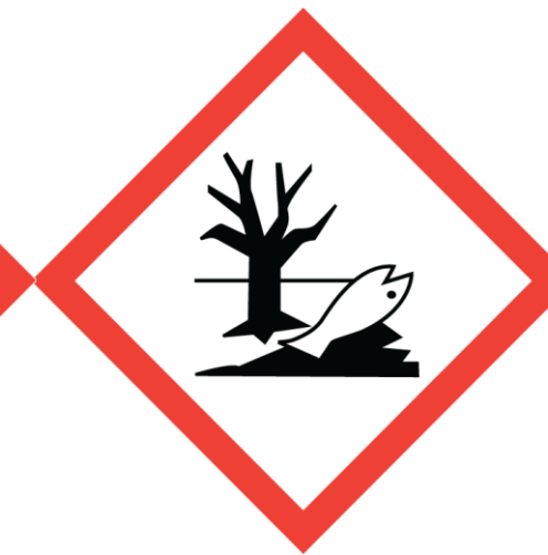
Peligroso para el medio ambiente