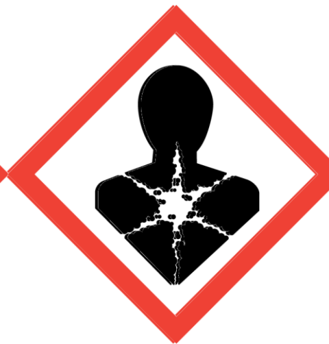
CMR Sensibilizante Categoría alta